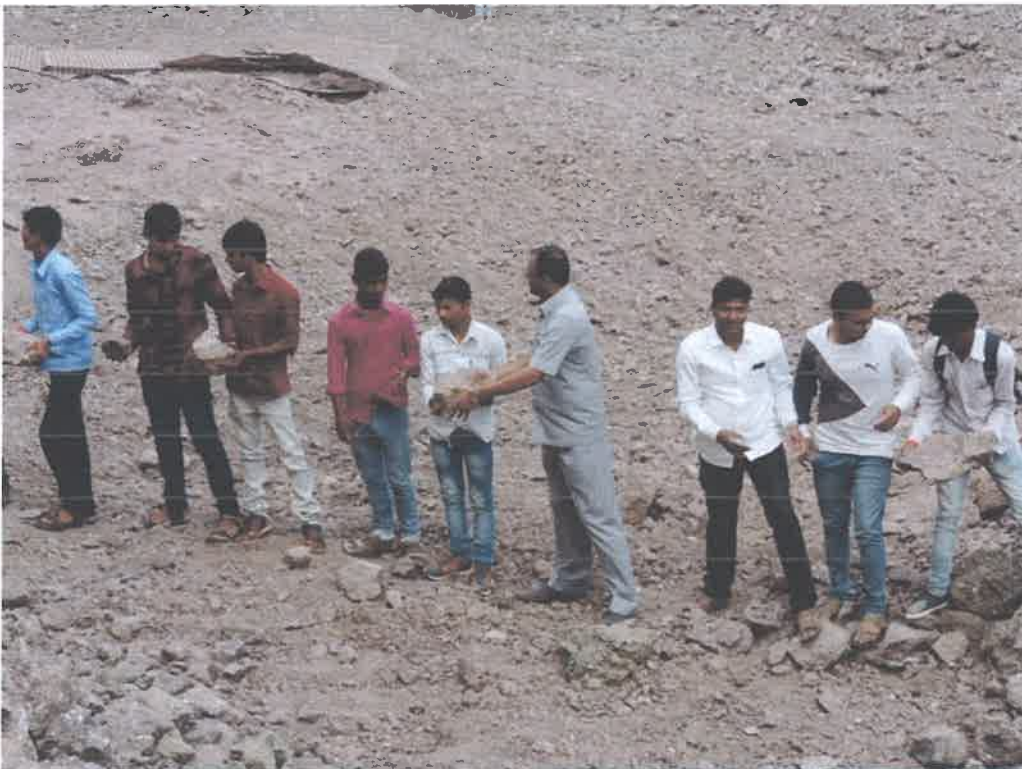
Staff & Students @ Physical Work in adopted village