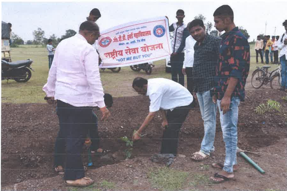
Hon. Prin. Dr. Nimbore @ Tree Plantation