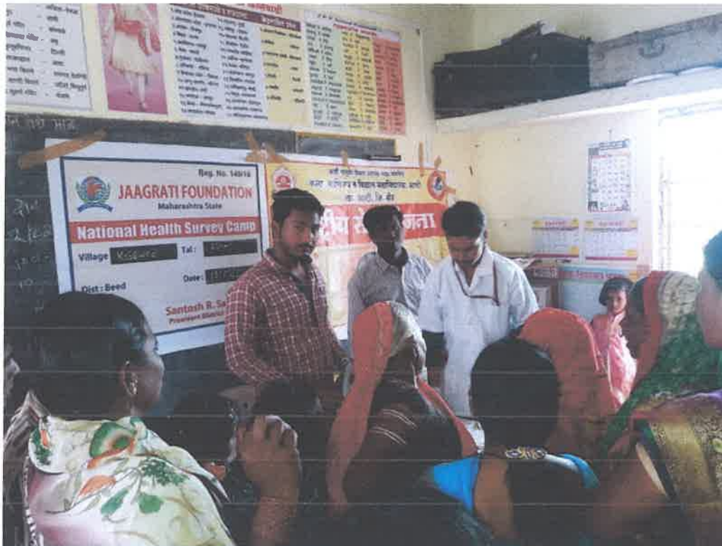
Doctors team in Kasewadi for Health Check Up Camp