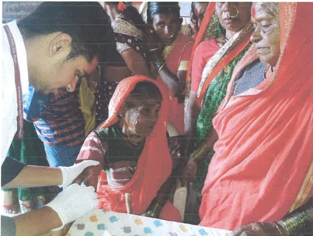
Active Participation of Villagers in the Camp