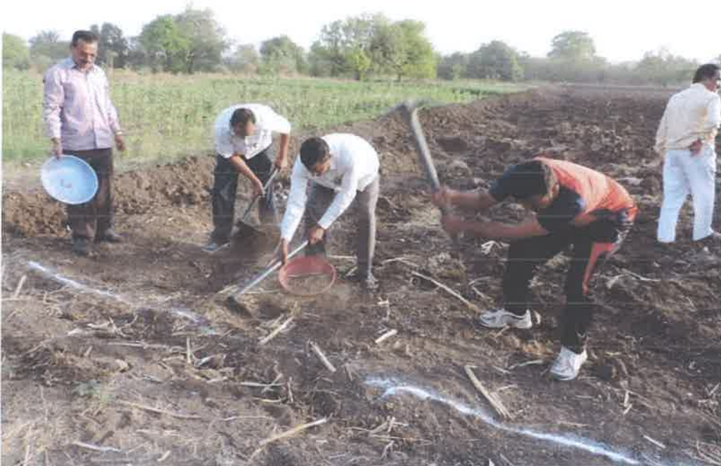
Staff with villagers in Water Harvesting Work