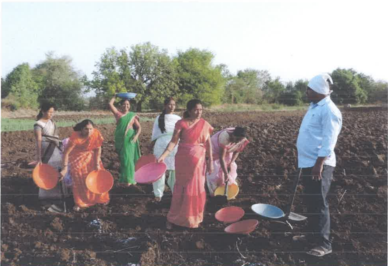
Active Participation of Staff in Physical Work