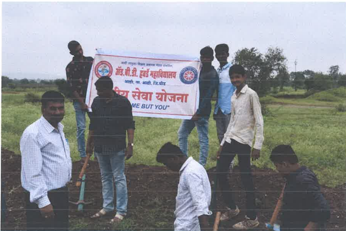
Tree Plantation Programme in Adopted Villages