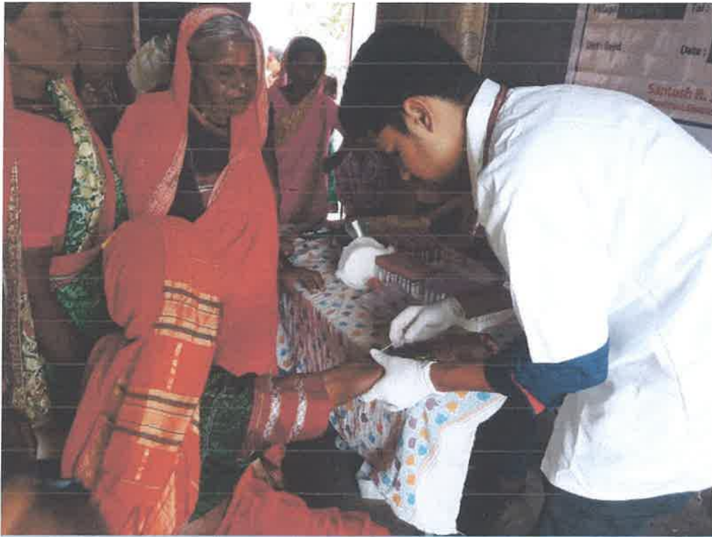
Free Treatment to the Poor and Needy Villagers