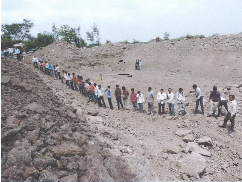
Staff, Students and Villagers in Water Harvesting Work