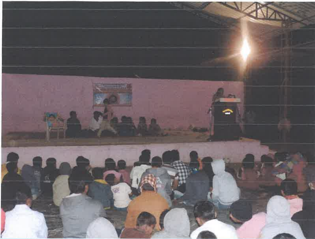
Villagers' response in audience for orientation