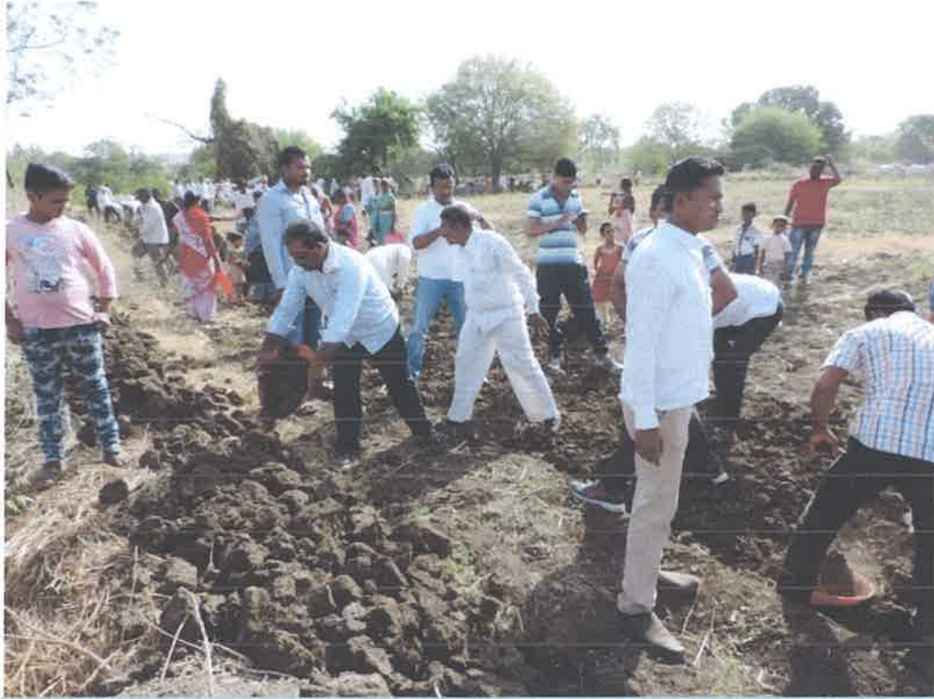
Water Harvesting Policy implemented in adopted village