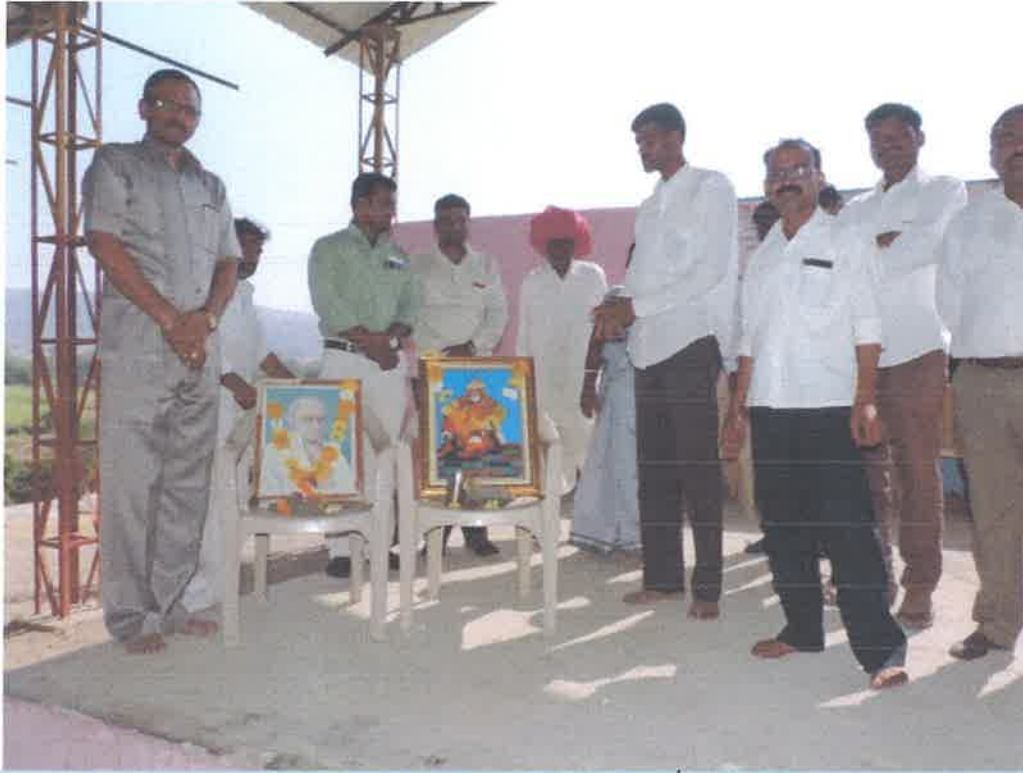
Camp begins with Mahatma Gandhi & Gadge Baba thoughts