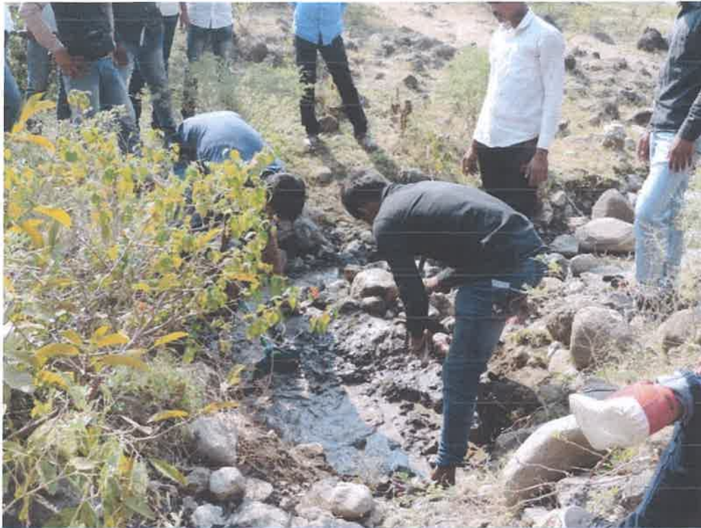
Students Participated Happily in Physical Work