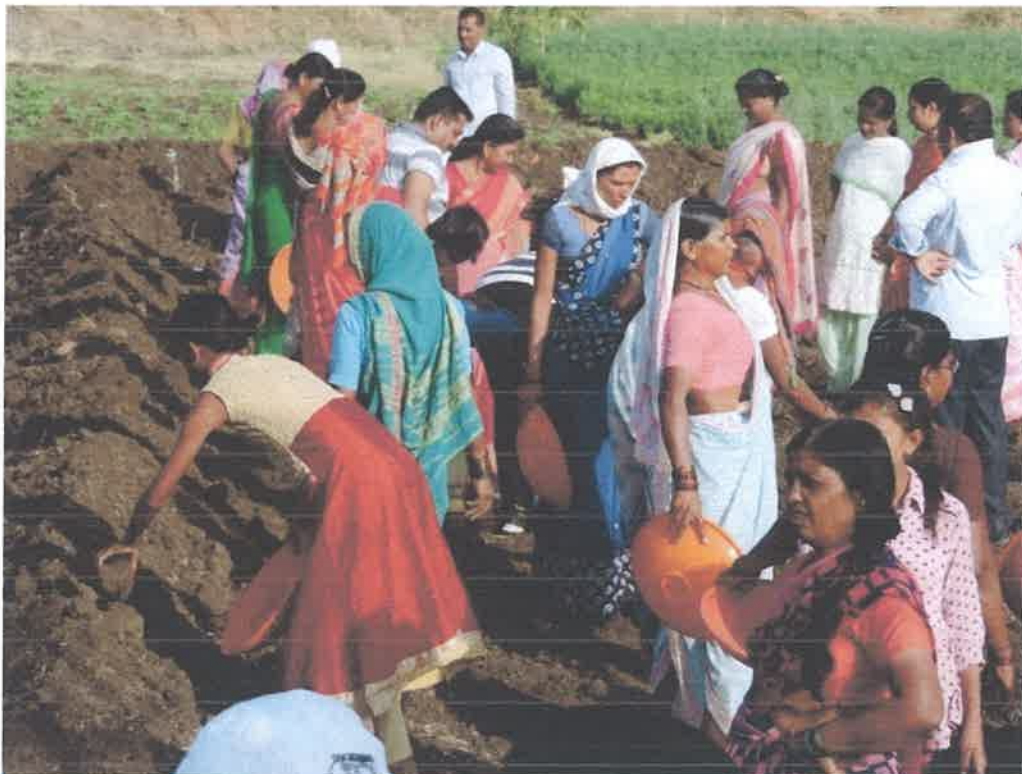
Staff with villagers in Shramdan Shibir