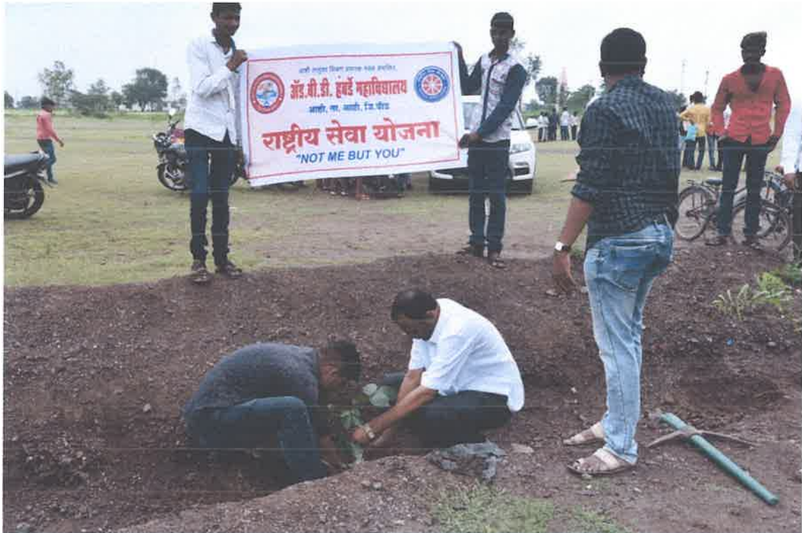
Tree Plantation in Adopted Village