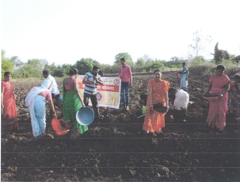
Staff Participated in Shramdan Shibir