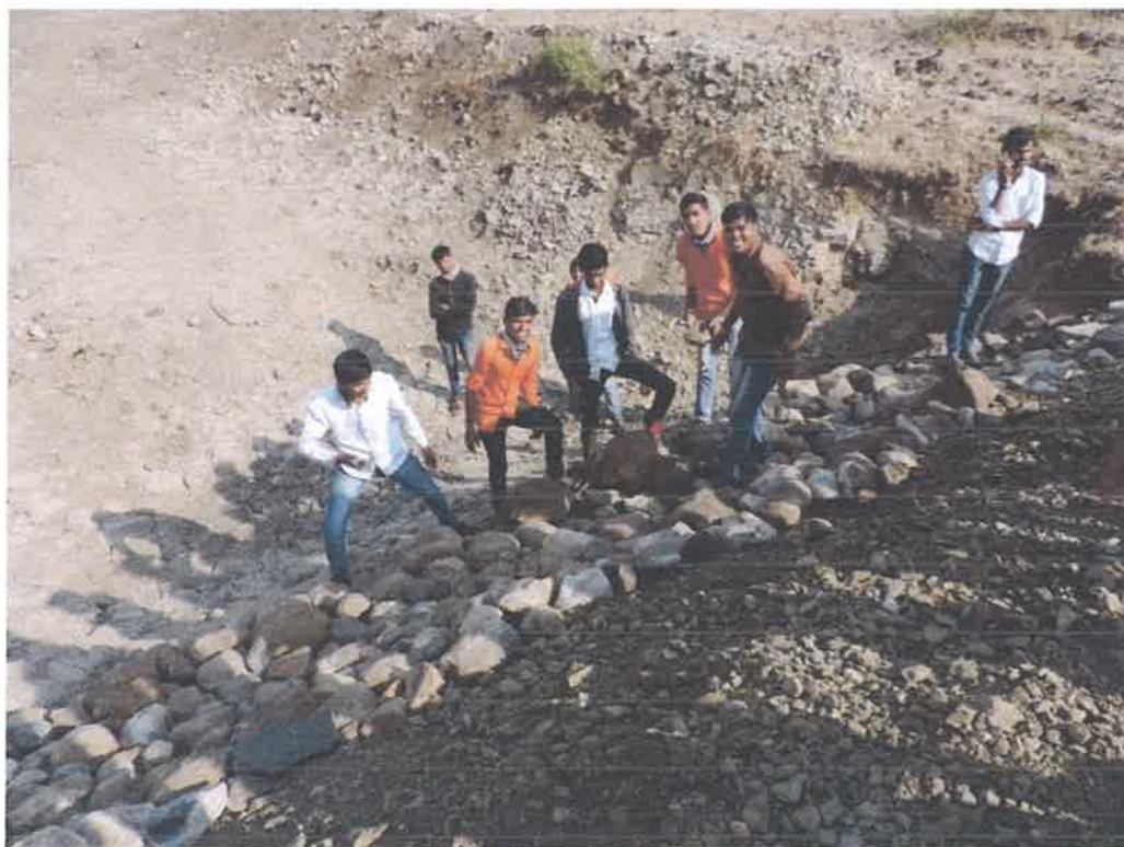
Students Contribution in Water Harvesting Policies