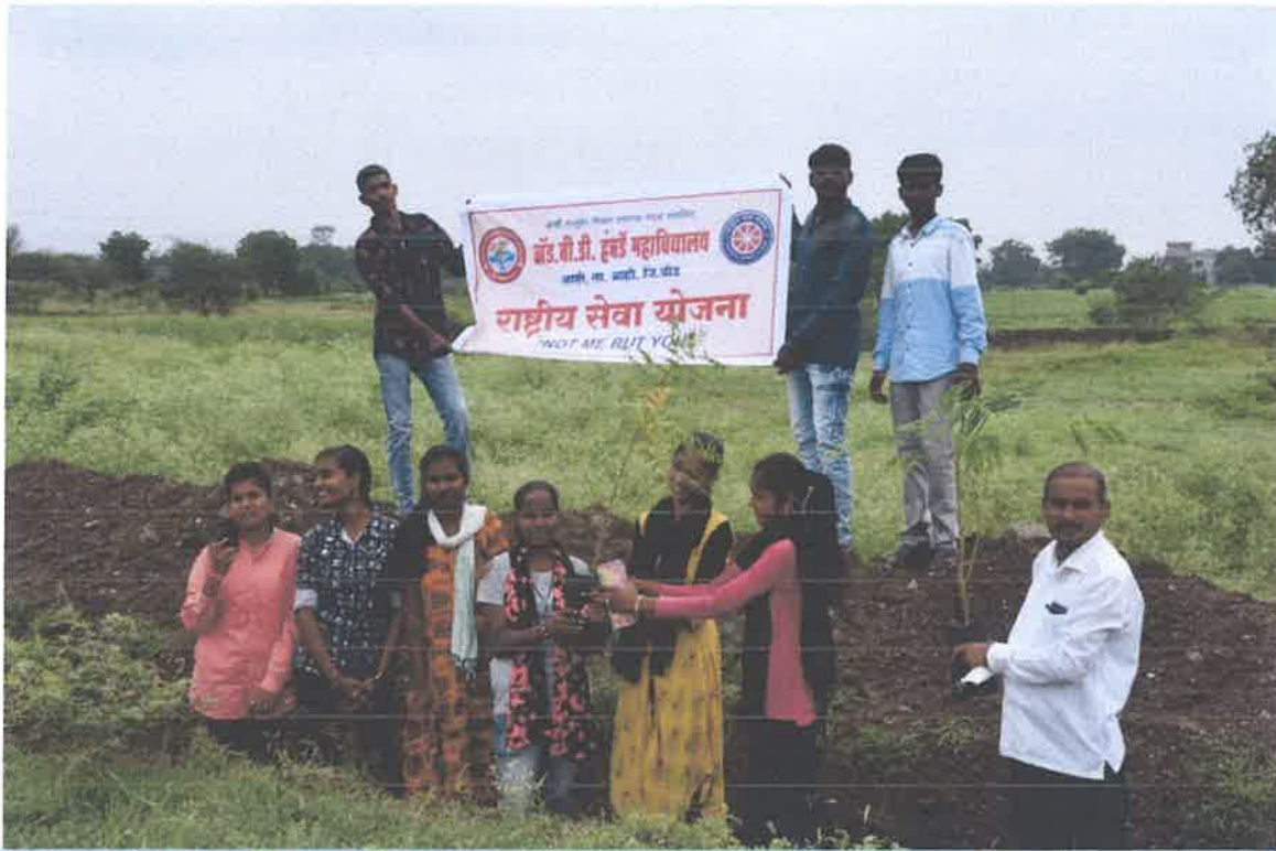
Students Participation in Tree Plantation Programme