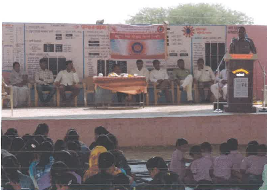
Hon. Prin. Dr. Nimbare addressing villagers & students