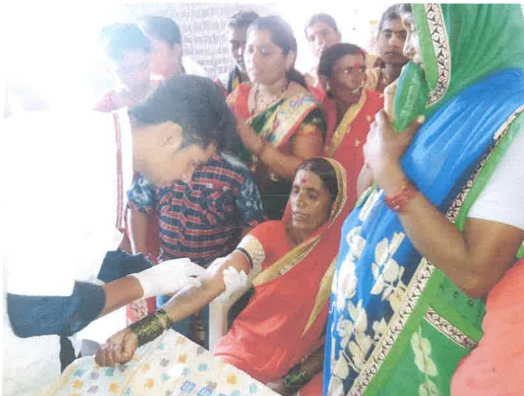
Villagers Response for Health Check Up Camp